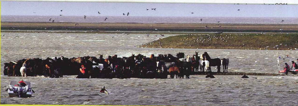
De paarden bij Marrum

H eel Nederland leefde mee toen in de eerste dagen van november 2006 ruim tweehonderd paarden door hoogwater vast kwamen te zitten op de kwelder bij het Friese Marrum. De door angst verstijfde paarden, dicht op elkaar gepakt op het minieme nog drooggebleven stukje land, werden door een spectaculaire reddingsactie even wereldnieuws. Lokale ruiters galoppeerden met hun paarden het water in en reden met de hele groep gestrande paarden in hun kielzog naar het veilige land.